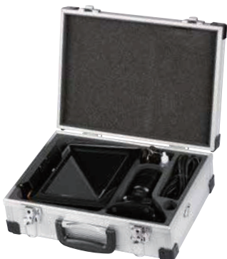
※モニターとケースがセットになっております。