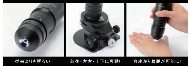
従来よりも明るい!

特殊スタンドを採用したことにより 身体のどの部位も観察することが可能になりました。