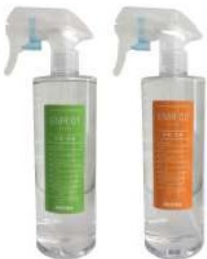
EMR 01 (エマーワン) 各150ml EMR 02 (エマーツー) 各1,500円(税別)