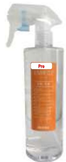
EMR 02 Pro (エマーツープロ) 150ml 1,800円(税別) 500ml 5,500円(税別)

株式会社エム・エス・ビー 担当者：阿部 〒496-0907 愛知県愛西市稲葉町米野107-8 Tel0567-69-4390